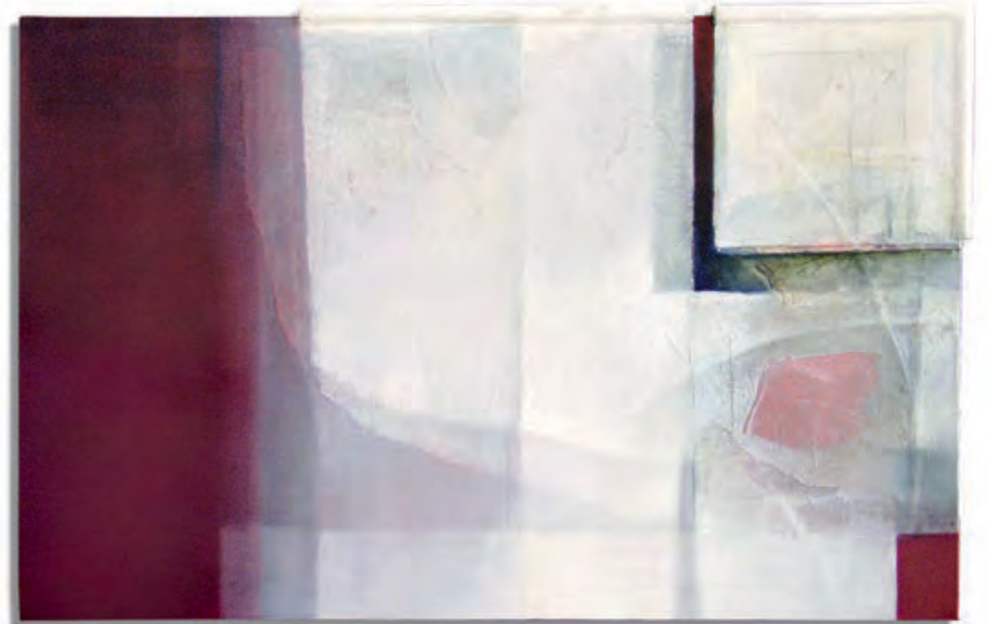
Seitentheorie und unerwartete Entdeckung • Mischtechnik/Leinwand • 110 x 75 cm • 2003

Die Kunst beginnt dort, wo die Wirklichkeit endet.